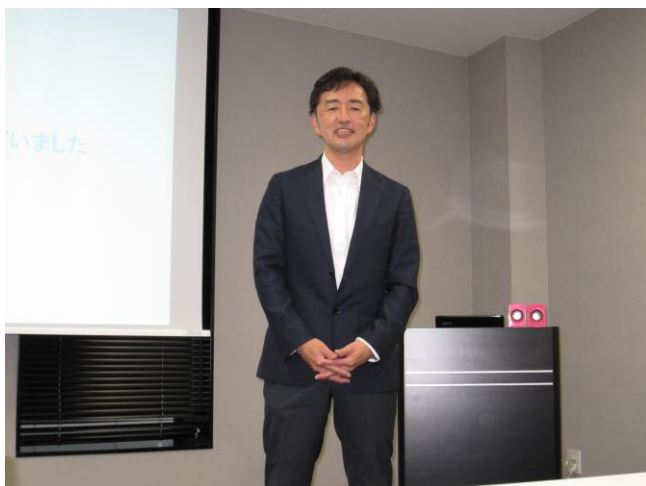
池畑副委員長 閉会挨拶