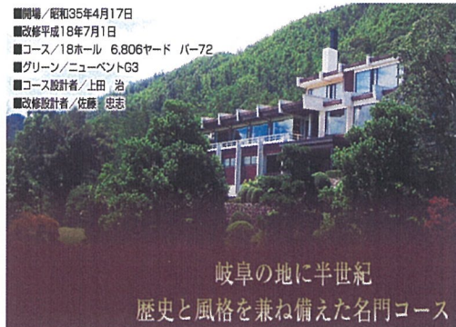
岐阜の地に半世紀 歴史と風格を兼ね備えた名門コース

■開場/昭和35年4月17日 ■改修平成18年7月1日 ■コース/18ホール 6,806ヤード パー72 ■グリーン/ニューベントG3 ■コース設計者/上田 治 ■改修設計者/佐藤 忠志