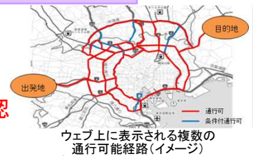
ウェブ上に表示される複数の通行可能経路(イメージ)