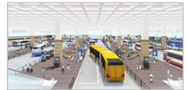
特定車両停留施設(イメージ)