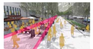
歩行者利便増進道路(イメージ)